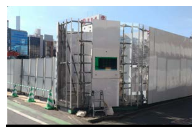
さいたま市再開発工事