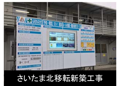
さいたま北移転新築工事