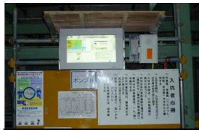
ポンプ場改築工事