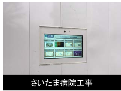
さいたま病院工事