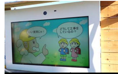
川口市県道替え工事