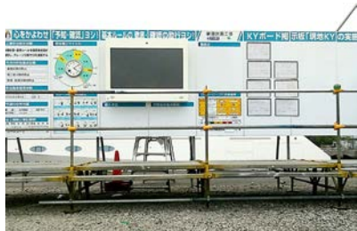
横浜新港計画工事新港