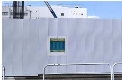
東京海上 新築工事