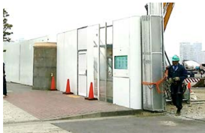
みなとみらい新港工事