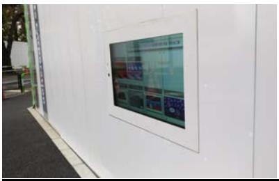
トレーニングセンター新設工事