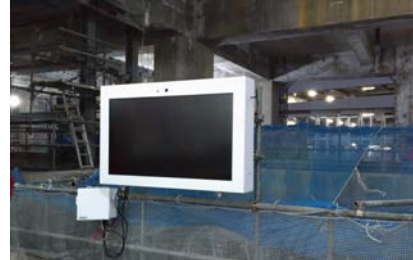
八王子駅再開発工事

スーパーゼネコン3社 中堅ゼネコン 20社 地場コン 30社以上 合計100現場以上