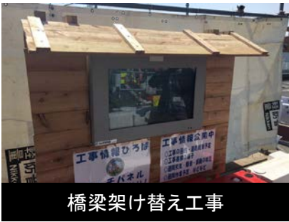
橋梁架け替え工事