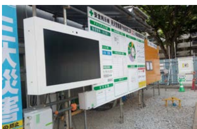
所沢警察署庁舎新築工事