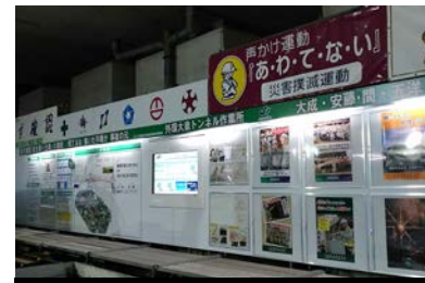
外環大泉トンネル工事